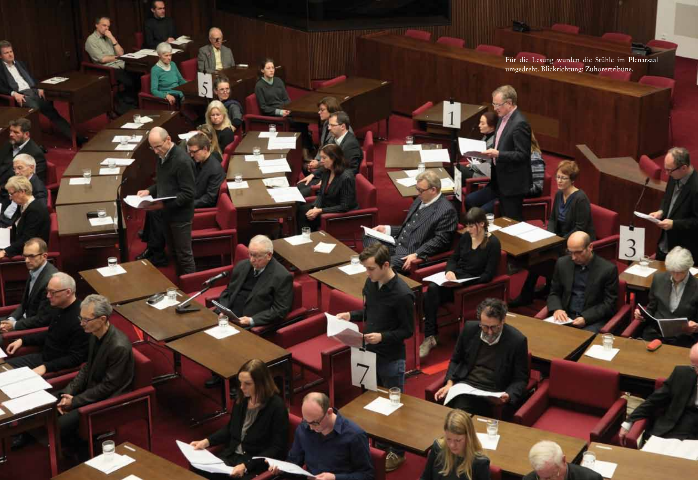
Für die Lesung wurden die Stühle im Plenarsaal umgedreht. Blickrichtung: Zuhörertribüne.