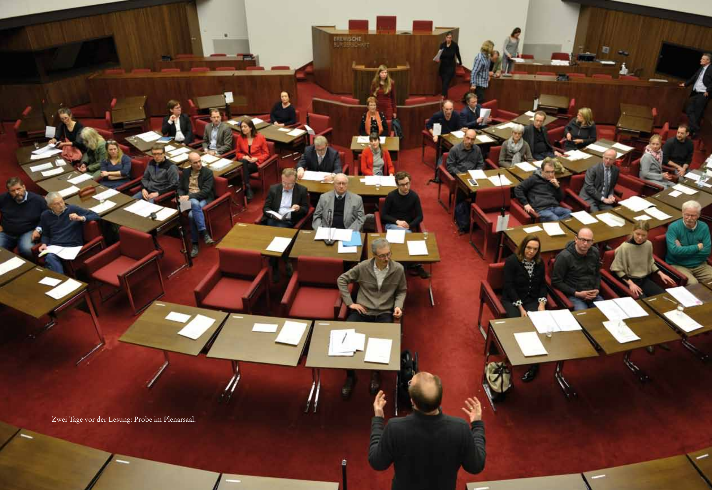
Zwei Tage vor der Lesung: Probe im Plenarsaal.